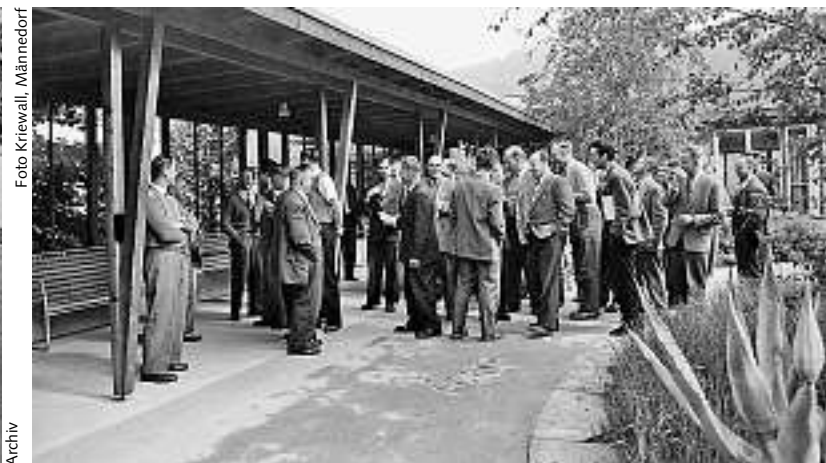
... und Tagungen zu Berufsfragen prägen das Programm.