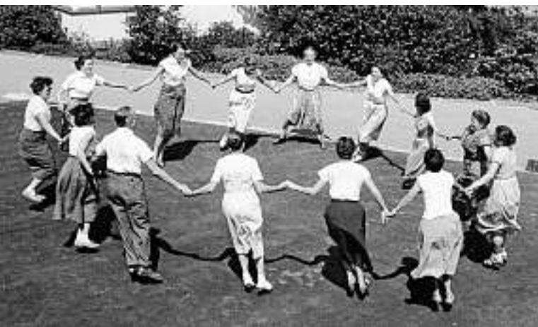
Boldern in den 50er Jahren: Frauenarbeit...

Das erste Betriebsjahr zeigt bereits, dass die Jugendgruppen vorwiegend übers Wochenende kommen, ihre Ferienlager hingegen lieber im Tessin oder in den Bergen durchführen. Die Zahl der erwachsenen Besucherinnen und Besucher übersteigt die der Jugendlichen immer mehr. Damit steht die Wirklichkeit im Widerspruch zu den ursprünglichen Erwartungen. Boldern hat für Jugendlager nicht in genügendem Mass den Reiz der Ferne. Umso ausgiebiger nutzen die Erwachsenen die Heimstätte. Das geht so weit, dass der Vorstand 1951 beschliesst, Boldern um einen freistehenden zweiten