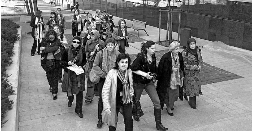
EPIL-Frauen auf dem Weg zu einer Begegnung in Beirut.

Rund 30 Frauen haben sich im Februar 2009 in Beirut getroffen, wo der zweite Studiengang des Europäischen Projekts für Interreligiöses Lernen (EPIL) mit einem Modul zum Thema «Pluralismus» zu Ende ging. Zum anschließenden Symposium «Vielfalt umarmen» konnte EPIL in den Räumen des armenisch-orthodoxen Catholikosates in Antelias eine Reihe von Referentinnen und Referenten, unter ihnen zwei Minister der libanesischen Regierung, sowie rund 80 Teilnehmende begrüßen.