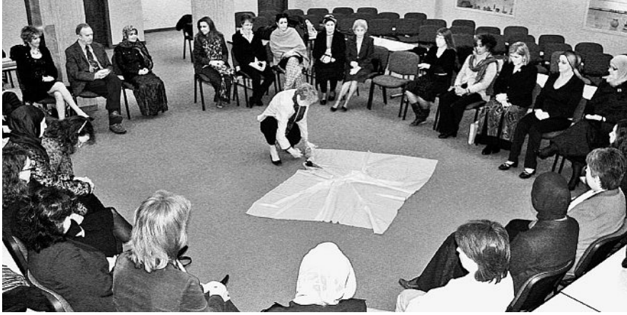
Schluss-Meditation des EPIL Studiengangs 2007 – 2009: Das Tuch der Einheit zerschneiden.

Gleichzeitig war der Fokus der Programme auf Probleme und Initiativen von Frauen im interreligiösen Zusammenleben gerichtet. Besonders beeindruckend etwa war der Besuch im Wiener Allgemeinen Krankenhaus, wo ein interreligiöses Seelsorgerinnenteam zusammen mit den Hebammen ein Ritual für zu früh oder totgeborene Kinder entwickelt hat, das den Eltern aus allen Religionen einen Abschied in Würde ermöglicht. Ähnlich bewegend war der Besuch bei den Frauen in der Gedenkstätte von Srebrenica, dem Ort des Massakers an etwa 8000 bosniakischen Knaben, Männern und Greisen. Es sind die Frauen, die mit ihrer Präsenz die Erinnerung an das Unrecht und den Schmerz aufrecht erhalten und ihre Toten zurückfordern, um ihnen wenigstens die Ehre eines ordentlichen Begräbnisses zu erweisen.