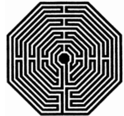
Achteckiges Labyrinth in der Kathedrale von Amiens, 12. Jh. (weiss: die Grenzen)

Labyrinth im eigentlichen Sinn dagegen haben einen einzigen, eindeutigen Weg, den längstmöglichen von aussen zur Mitte. Ihre klare Struktur ist allerdings nur aus der Vogelschau erkennbar. Wer sich auf den durchs Labyrinth zur Mitte begibt, verliert leicht die Orientierung, muss sich ihm überlassen und macht dabei überraschende Erfahrungen.