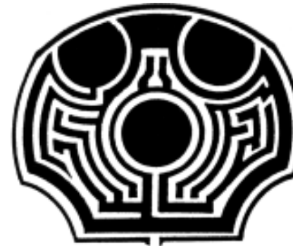
Irrgarten (Maze) in Somerleyton Hall, Suffolk, GB, 1846 (weiss: die Wege)

Das Wort Labyrinth steht im allgemeinen Sprachgebrauch seit der Antike immer wieder für Irrgärten, in denen man den Weg verlieren kann und suchen muss. Darin gibt es Sackgassen und Kreuzungen. Labyrinth im Sinn von Irrgärten sind gleichbedeutend mit Abenteuer und Lebensgefahr. Sie waren besonders beliebt in der Renaissance und in der Barockzeit.