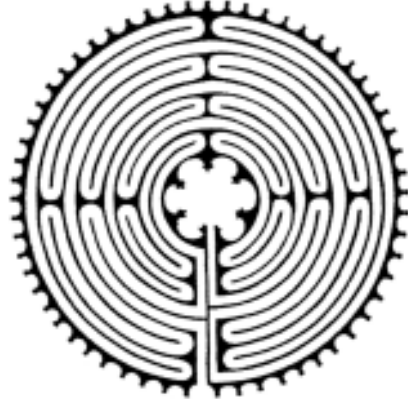
Gotisches Kirchenlabyrinth, Kathedrale von Chartres, um 1220

Das Labyrinth im Palast des Königs Minos auf Kreta ist vermutlich eine Erfindung der griechischen Mythologie. Aber die Kreterinnen tanzten der Überlieferung nach den Kranichtanz in einer Spirale mit Wendungen – eine gute kurze Definition für das Labyrinth.