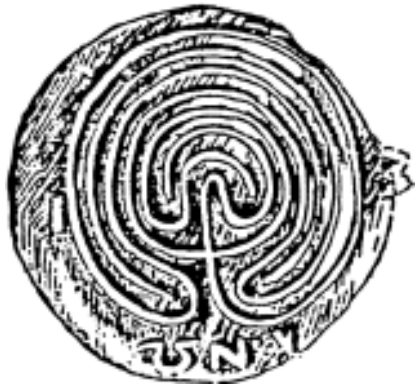
Klassisches sieben-gängiges Labyrinth, Münze aus Kreta, 2. Jh. v.C.

Labyrinth sind Ursymbole der Menschheit, die ältesten erhaltenen über 4'000 Jahre alt – ein Sinnbild für den Weg des Lebens zwischen Geburt und Tod, dem Ziel bald näher, bald ferner – und unversehens dort angekommen, wenn man es schon kaum mehr erwartet. Im Labyrinth haben Menschen der verschiedensten Kulturen die Feste des Lebenszyklus und des Jahreskreislaufs «begangen» – begangen im ursprünglichen Sinn des Wortes.